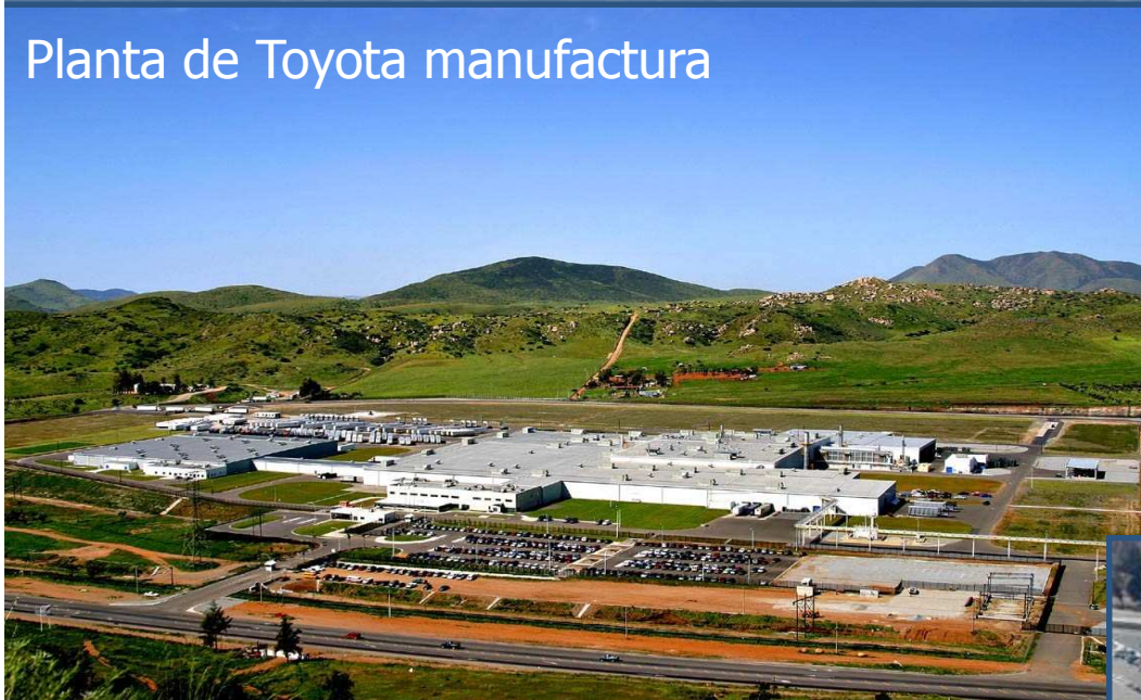
Planta de Toyota manufactura